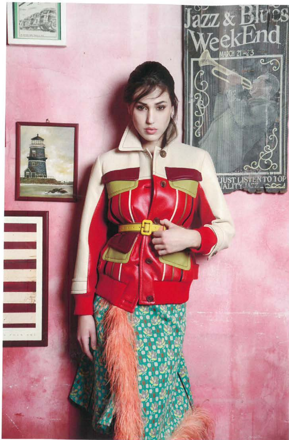
Кожаная куртка, юбка из полиамида, резиновый ремень, Prada