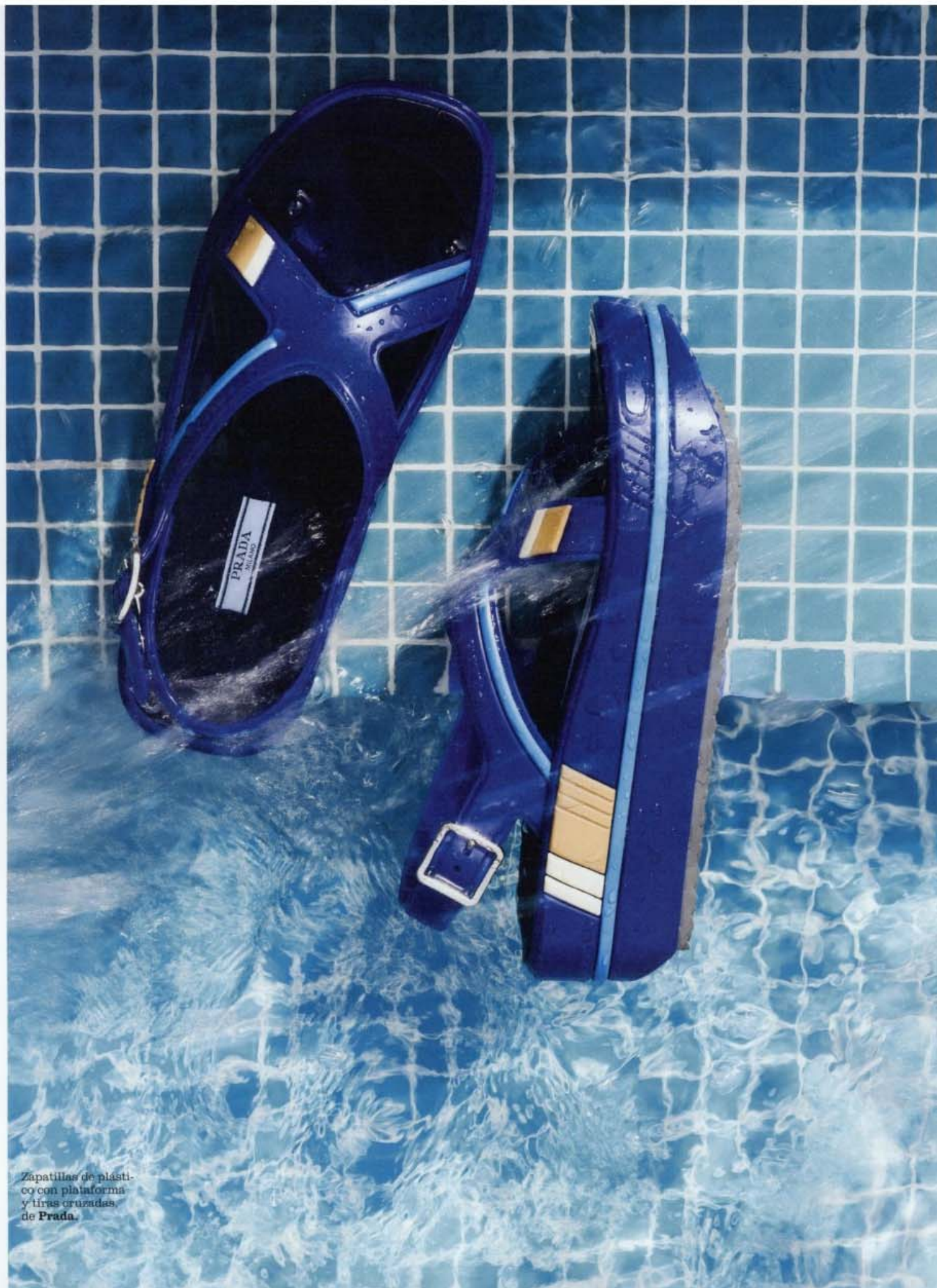
Zapatillas de plástico con plataforma y tiras cruzadas de Prada.