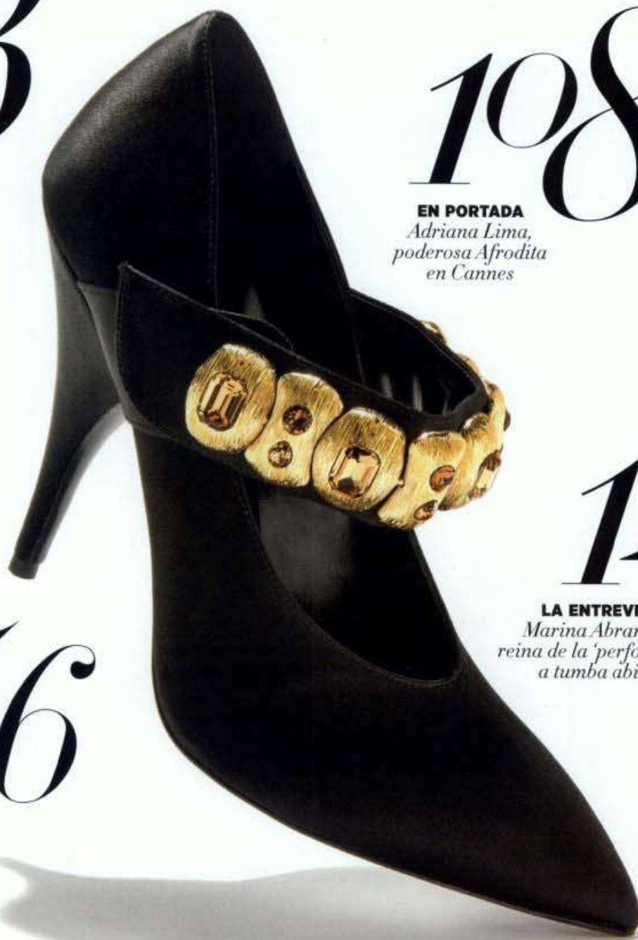
Zapato de PRADA.

EL REPORTAJE En el rodaje de 'Wonder Woman' con Gal Gadot