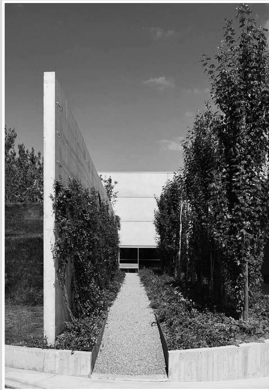
Nuovo Polo Logistico di Levanella

Oltre ai progetti sopra citati, nello stesso anno il Gruppo Prada ha proseguito la ristrutturazione di un magazzino ad Arezzo, completato la ristrutturazione dello stabilimento di Scandicci, e avviato l'ambizioso progetto di riorganizzazione della propria logistica con la realizzazione del Nuovo Polo Logistico di Levanella (Arezzo), progettato dall'architetto Guido Canali.